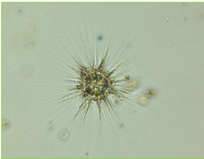
Raphidiophrys sp. (ラフィディオフリス) 太陽虫類

体は球形で放射状に有軸仮足を出す。有軸仮足の根元は粘液と多数の骨片におおわれている。