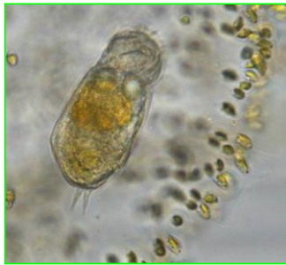
Cephalodella sp. (カシラワムシ) 輪虫類