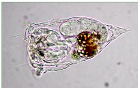
Synchaeta oblonga (ナガマルドロワムシ) 輪虫類

体は透明な鐘形で、足は短く、先端の趾(あしゆび)は微小である。頭冠は幅広く、前面には4本の長い剛毛があり、両端には長い繊毛をもつ耳状の突起がある。