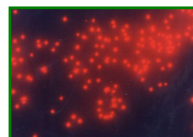
ピコ植物プランクトン 1,000倍G励起で撮影