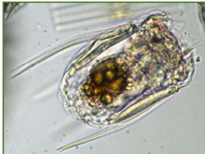
Polyarthra vulgaris (ハネウデワムシ) 輪虫類

体は四角く、4カ所に3本ずつ鳥の羽状の付属物を有する。前部に2本の触角がある。琵琶湖、瀬田川で見られるワムシのなかまの中で最も多く見られる種類である。