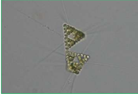
Errerella bornheimiensis (エレレラ) 緑藻綱

球形の細胞が8～256細胞集まって三角錐状の群体を作る。各細胞には1本の細長いトゲがある。世界的に温帯に広く分布する。ミクラクチニウムは各細胞に2～3本のトゲを持っているが、本種は1本のみのトゲを持っている。