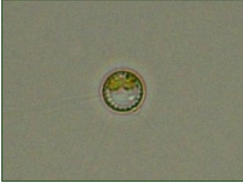
Cyclotella sp. (ヒメマルケイソウ) 珪藻綱

細胞は、横から見ると長方形に見えるが、真上から見ると円形に見える。中心付近は平らか、不規則な点紋があり、周辺部分には放射状の点紋もしくは条線がある。