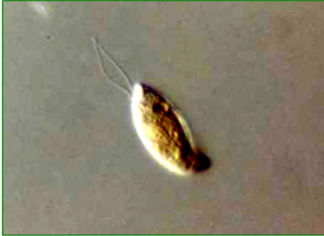
Cryptomonas sp. (クリプトモナス) 褐色鞭毛藻綱

体はやや扁平な長楕円形で、頂端は凹んで発達した陥入部を形成している。陥入部から伸びたほぼ等しい長さの2本の鞭毛を使って、進行方向を軸にして回転しながら泳ぐ。大きな葉緑体を持ち、その色は黄色、褐色、オリーブ色などさまざまである。