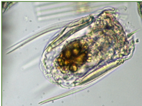
Polyarthra vulgaris (ハネウデワムシ) 輪虫類

体は四角く、4カ所に3本ずつ鳥の羽状の付属物を有する。前部に2本の触角がある。琵琶湖、瀬田川で見られるワムシのなかまの中で最も多く見られる種類である。