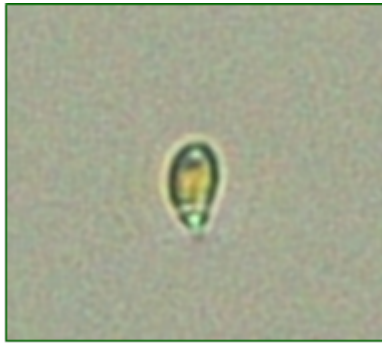
Rhodomonas sp. (ロドモナス) 褐色鞭毛藻綱

細胞は、長楕円形で長さが約10 \mu mと小型であり、葉緑体は少し赤みを帯びている。2本の鞭毛を有する。