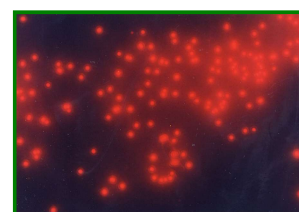
ピコ植物プランクトン 1,000倍G励起で撮影