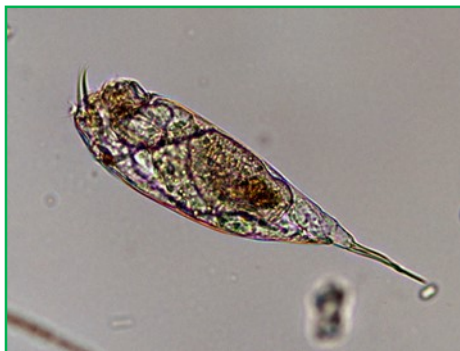
Trichocerca sp. (ネズミワムシの一種) 輪虫類

体は円筒形で、2本の趾(あしゆび)の長さに差があり、1本の趾は目立たない。頭部の歯の有無や背面の膜状隆起などの特徴により種類が分かれる。