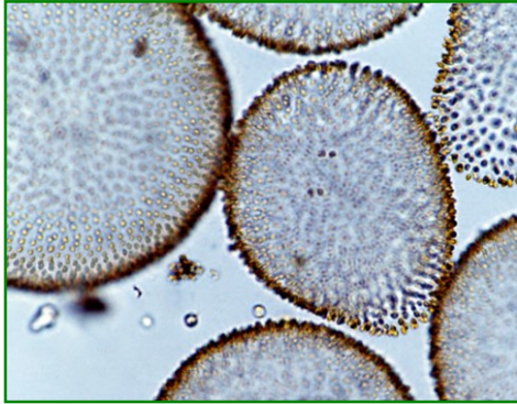
Uroglena americana (ウログレナ) 黄色鞭毛藻類

楕円形または倒卵形の細胞が寒天質の表層に規則正しく配列し、球状の群体を形成する。各細胞は不等長の2本の鞭毛を有する。生ぐさ臭を発生し、水道水の異臭味の原因となる藻類である。