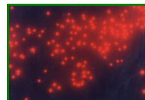
ピコ植物プランクトン 1,000倍G励起で撮影