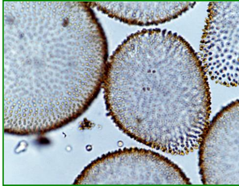
Uroglena americana (ウログレナ) 黄色鞭毛藻類

楕円形または倒卵形の細胞が寒天質の表層に規則正しく配列し、球状の群体を形成する。各細胞は不等長の2本の鞭毛を有する。生ぐさ臭を発生し、水道水の異臭味の原因となる藻類である。