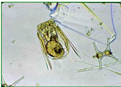
Polyarthra vulgaris (ハネウデワムシ) 輪虫類

体は四角く、4カ所に3本ずつ鳥の羽状の付属物を有する。前部に2本の触角がある。琵琶湖、瀬田川で見られるワムシのなかまの中で最も多く見られる種類である。