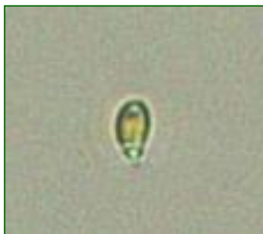
Rhodomonas sp. (ロドモナス) 褐色鞭毛藻綱

細胞は、長楕円形で長さが約10μmと小型であり、葉緑体は少し赤みを帯びている。2本の鞭毛を有する。