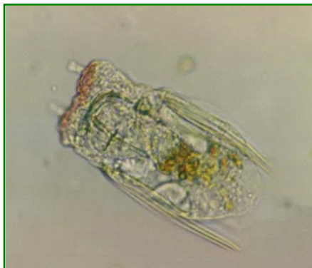
Polyarthra vulgaris (ハネウデワムシ) 輪虫類

体は四角く、4カ所に3本ずつ鳥の羽状の付属物を有する。前部に2本の触角がある。琵琶湖、瀬田川で見られるワムシのなかまの中で最も多く見られる種類である。