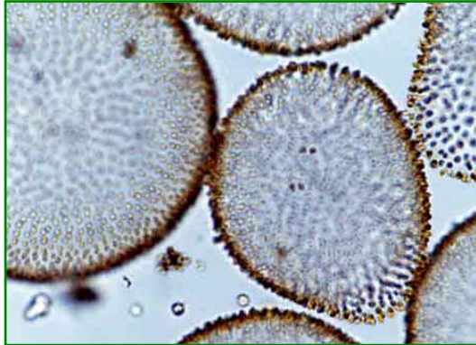
Uroglena americana (ウログレナ) 黄色鞭毛藻類

楕円形または倒卵形の細胞が寒天質の表層に規則正しく配列し、球状の群体を形成する。各細胞は不等長の2本の鞭毛を有する。生ぐさ臭を発生し、水道水の異臭味の原因となる藻類である。