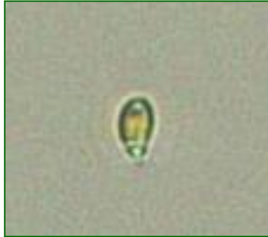
Rhodomonas sp. (ロドモナス) 褐色鞭毛藻綱

細胞は、長楕円形で長さが約10μmと小型であり、葉緑体は少し赤みを帯びている。2本の鞭毛を有する。