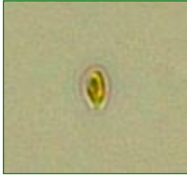
Rhodomonas sp. (ロドモナス) 褐色鞭毛藻綱

細胞は、長楕円形で長さが約10μmと小型であり、葉緑体は少し赤みを帯びている。2本の鞭毛を有する。