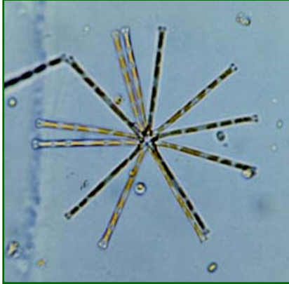
Asterionella formosa (ホシガタケイソウ) 珪藻綱

4～32個の細胞が端で接着し、星形の群体を作る。細胞の殻面を見ると(通常は殻環面が見えている)両端が丸くなった長い棒形をしている。琵琶湖では以前から多く見られる種類である。