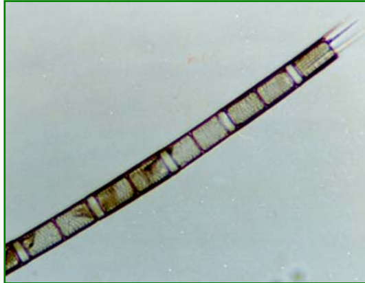
Aulacoseira granulata (アウラコセイラ) 珪藻綱

細胞は円筒形で、糸状の群体を形成する。殻の側壁に斜めに走る点紋列がある。群体の両端に顕著な長い棘状突起を有する。