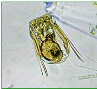
Polyarthra vulgaris (ハネウデワムシ) 輪虫類