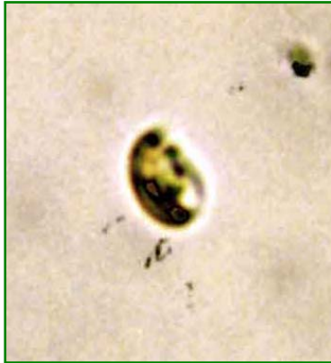
Rhodomonas sp. (ロドモナス) 褐色鞭毛藻綱

細胞は、長楕円形で長さが約10 \mu mと小型であり、葉緑体は少し赤みを帯びている。2本の鞭毛を有する。