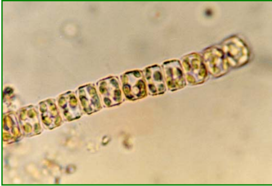
Cyclotella glomerata (ヒメマルケイソウ) 珪藻綱

細胞は、横から見ると長方形に見えるが、真上から見ると円形に見える。その直径は4～10μmと小さい。多数が鎖状に結合して群体をなす。