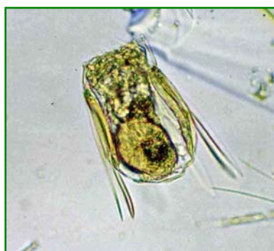
Polyarthra vulgaris (ハネウデワムシ) 輪虫類