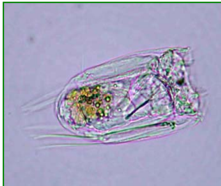
Polyarthra vulgaris (ハネウデワムシ) 輪虫類