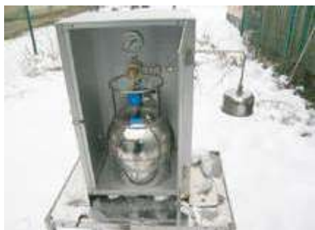
有害大気汚染物質のサンプリング