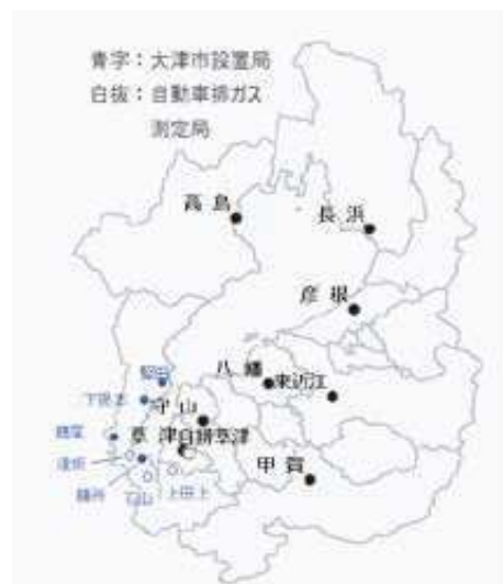
大気自動測定局位置図