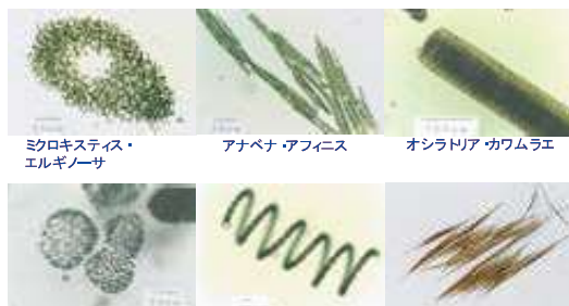
アオコを形成するプランクトン